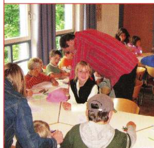
Kindertfest Juli 2009

mit der Evangelisch-Lutherischen Landeskirche in Bayern.