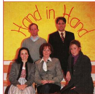
Der Vorstand v.l.n.r.